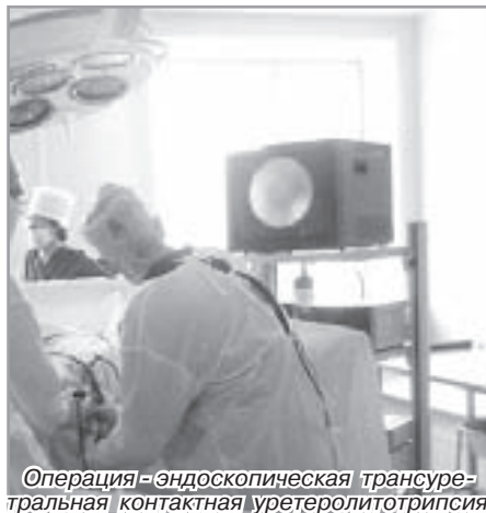
Операция-эндоскопическая трансуретральная контактная уретеролитотрипсия.

Флебэктомия (операция при варикозном расширении вен н/конечностей).